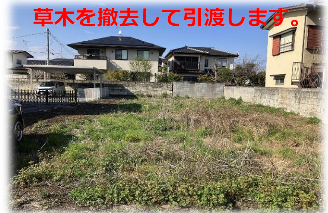
掲載写真 2024年4月撮影 現地土地 南側より撮影 ※街並み含む